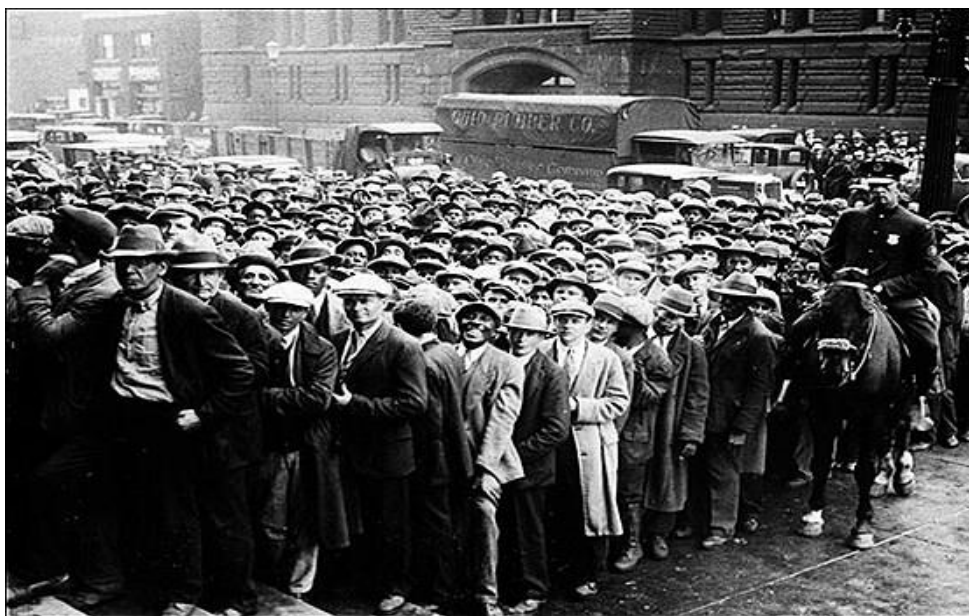
تظاهرات مردم در خیابان وال استریت

و بعد از آن هربرت کلارک هورر ، رئیس جمهور ایالات متحده لجوجانه اعلام کرد «رفاه در کنج خیابان است» و کارشناسان می گفتند فروپاشی ارزش سهام بورس نمی تواند به «اقتصاد واقعی» آسیب برساند. جالب است بدانید دو روز پیش از این تاریخ، ایروینگ فیشر یک اقتصاددان بسیار مشهور و استاد دانشگاه ییل در روزنامه نیویورک تایمز تاکید کرده بود سطح قیمت سهام هنوز خیلی پایین است.